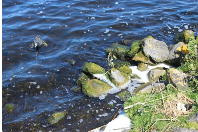
linksboven pa of ma Koet, rechtsonder vier oetjes in wording

Op de foto is ook een deel van het schuim te zien dat volop tegen de westelijke oever dreef, een cadeautje van de straffe westenwind van de afgelopen dagen.