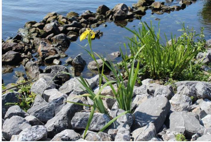
eenzame gele lis

De menselijk bonus bestond dit keer uit de kapitein van een passerend zandschip die net zo lang naar me bleef zwaaien tot ik terugzwaaide.