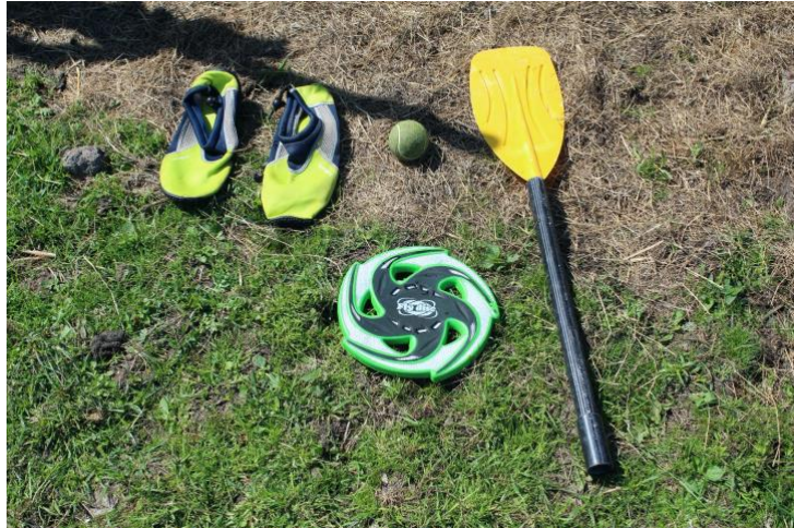
aftandse surfschoenen (op de steiger), de obligate tennisbal, een halve spaan en een (honden?)frisbee

Zou het spelevaren - of beter gezegd: filevaren - op Hemelvaartsdag voor extra veel afval op de Tengnagel hebben gezorgd? Nee dus, stelde ik vanochtend, 25 mei, vast. Of was iemand me voor geweest? Hoe het ook zij, de opbrengst vulde mijn vuilniszak voor driekwart. Voor het grootste deel stamgasten: snoep- en etenswaarverpakkingen, drankblikjes, plastic tasjes, plastic flesjes en slechts 1 glazen wijnfles. Geen groepsportret daarom maar wel een close-up met het thema 'sport en spel'.